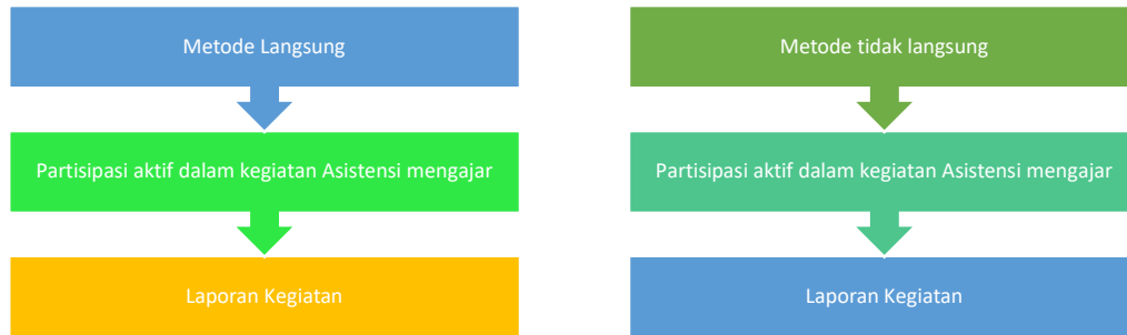
Gambar 3 Metode Pelaksanaan